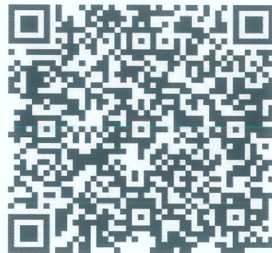
图 2 钉钉学员群二维码